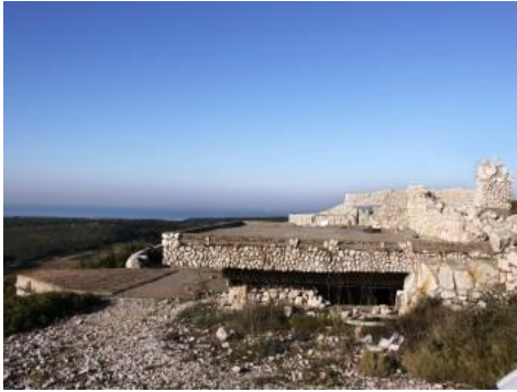
Chemin des cavalas - 13500 Martigues

Au cours de cette randonnée, vous découvrirez plusieurs bunkers aux vocations multiples, à la fois dépôt de munitions, poste d'observation ou emplacement de pièces d'artillerie et plusieurs casemates.